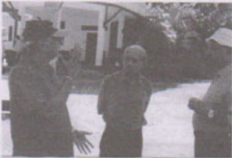
-- 24 වෙනි පිටුවේ බලන්න --

සාම්ප්‍රදායික ගෘහ උපකරණ දෙකක් වන කුල්ල හා පෙන්නරය පිවිතයට බොහෝ දේවල් කියා දී ඇත. පිවිත පරමානන්දය කේරුම් හැගීමට ද එය ඉවහල් කර ගත හැක. කුල්ල මගින් ඉතිරි කරන්නේ ජන පිවිතයට අවශ්‍ය දේය. කුල්ලෙන් පොලා පොලා අපවිත්‍ර දේ ඉවත් කර ඉතිරි කරගන්නේ ප්‍රයෝජනවත් දේ පමණකි. එතෙක් පෙන්නරයෙන් හලා ඉතිරි කර ගන්නේ අනවශ්‍ය දේය. ප්‍රයෝජනවත් දේ පෙන්නරයේ දැලෙන් හලා දමයි. මේ අනුව කල්කිරීම, පසු තැවීම, කරනව, ද්වේශය පොලා පොලා ඉවත් කරන කුල්ලක් මෙන් පරමානන්දය කේෂ කර ගමු.