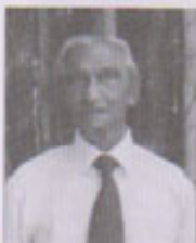
ඩබ්.ඩී.ඒ. චේමනති - (554)

ගෝමස් මහතා ඔහුගේ පිළිතුරේ කීප තැනක මා අදහස් පටලවා ගෙන ව්‍යාකූල වී ඇති බව කියයි. ඒ කියුම් වලට සරිලන සාරවත් බවක් ඔහුගේ පිළිතුරේ නම් නැත. ඒ තුළ ඔහුගේ තර්ක පිළිගත හැකි කරුණු මත ඉදිරිපත් කරනවා වෙනුවට අඩු වන විභාගයෙන් ආගම් කතුවරුන්ගේ කියුම් උපුටා දක්වා ඇත. එය ප්‍රතිවාදීන් තිරුත්තර කරන අයුතු ප්‍රයෝජන ගැනීමකි. ඒ උත්තමයන්ට ගරු කරනු වස් ප්‍රතිවාදීන් හිතව වෙත්. කෙසේ වෙතත් ගෝමස් මහතාට මම ස්තූති කරමි. ඔහු අහස ආගම් වලට දක්වන ගෞරවය සැලකිල්ල අගය කළ හැකිය.