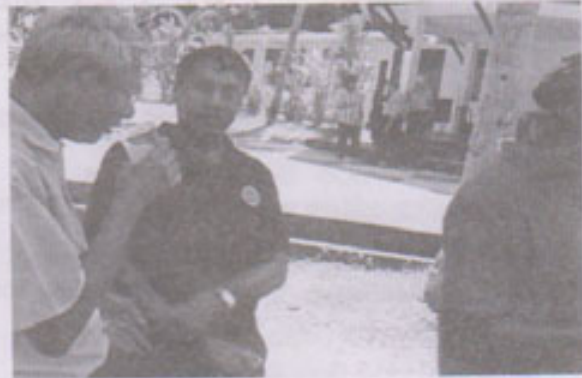
මොරටුව කිට්ටුව ඇක්වාපර්ල් හි දී.....